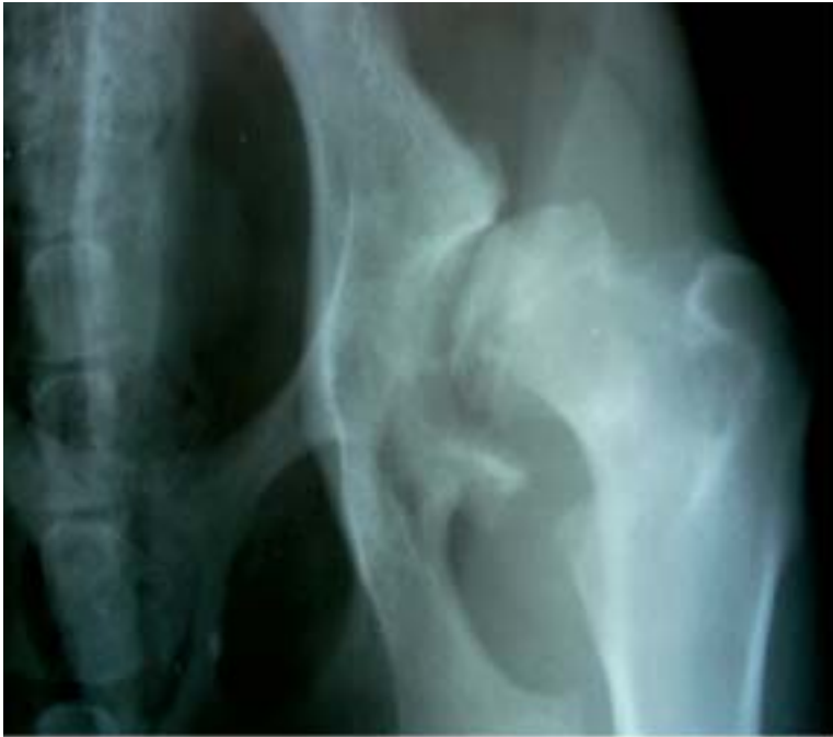
Cambios degenerativos apreciables en las radiografías hechas a un perro con displasia de cadera.

Cuantas más generaciones tengamos libres de displasia mayor es la probabilidad de tener una camada con todos los individuos libres de displasia