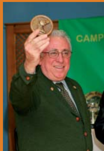
Jueces, personalidades y público disfrutaron de un magnífico espectáculo en la ceremonia inaugural del Campeonato del Mundo de Bracos Alemanes.